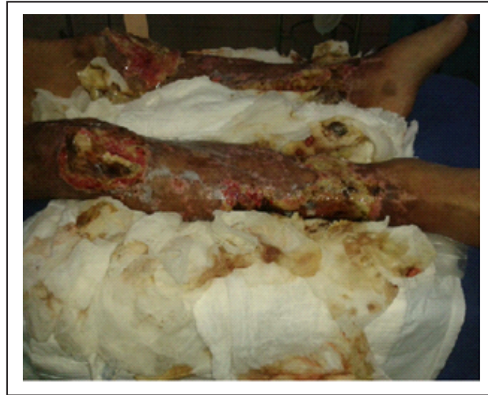
Gráfico 3. Lesiones necróticas de miembros inferiores