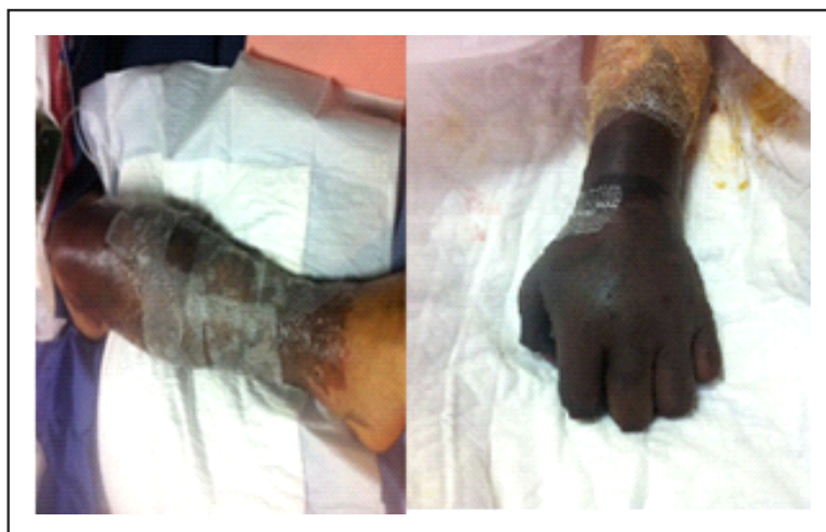
Gráfico 2. Lesiones necróticas de manos y piernas

Como parte de su evolución y dentro de las complicaciones del síndrome desarrolla púrpura cutánea en cara, brazos y piernas desde su ingreso que posteriormente se tornan de características necróticas en manos, tercio distal de antebrazo, así como en tercio medio de muslo hasta tercio inferior de piernas (gráfico 2). Por la severidad de la necrosis y ante la necesidad de plantear amputación a nivel de extremidades se realiza angiogramía de miembros superiores e inferiores que reporta vascularización arterial en el lado derecho hasta la región de la muñeca principalmente por la arteria radial hasta la región del metacarpo y en el lado izquierdo hasta el tercio medio del antebrazo. En los miembros inferiores se logra visualizar de manera adecuada la vasculatura distal por medio de las tibiales anterior y posterior de ambos lados delimitándose parcialmente los arcos plantares. Existe importante edema de los miembros inferiores y superiores, con alteración de realce en las áreas distales, compatible con defectos de perfusión.